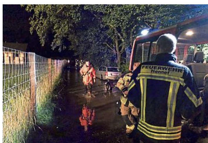
In der Flutnacht auf den 15. Juli 2021 stand auch der Campingplatz Lohmar unter Wasser.

In einem zweiten Schritt sollen anhand der Gefahrenkarten in den Kommunen besonders ge-