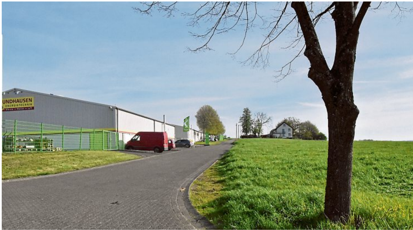
An die vorhandenen Betriebe soll sich nordöstlich von Leuscheid das Gewerbegebiet anschließen.